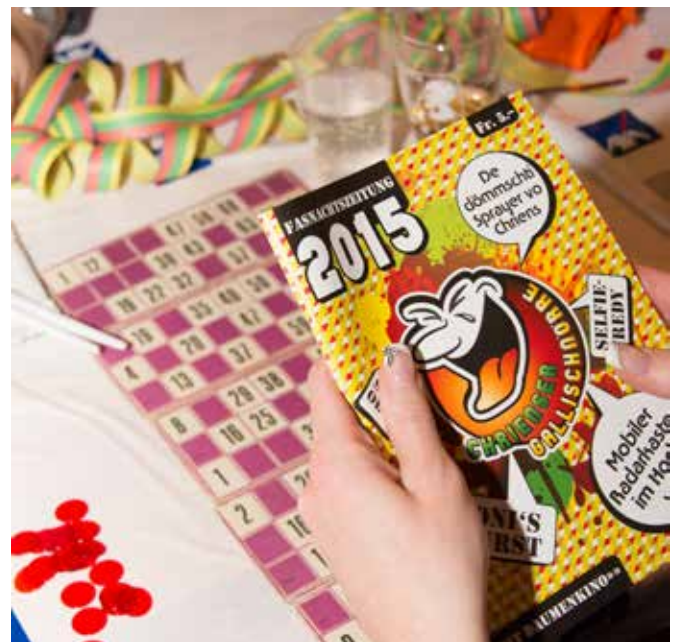
Nur an der Generalversammlung: Lotto und Gallischörre

Die letzte Generalversammlung mittlerweile die 30. fand am 16. Januar in der Gallihalle statt. Neben dem geschäftlichen Teil gab es auch dieses Mal wieder ein warmes Abendessen und anschliessend ein unterhaltsames Lottospiel in drei Gängen. Mitten im Spiel wurde die druckfrische Gallischörre angeliefert. Sie kam sofort in den Umlauf, einige Spieler verpassten deswegen bestimmt einige Lottozahlen.